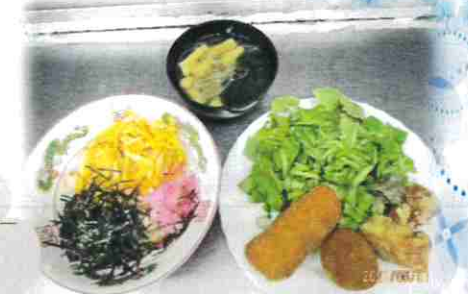
ちらし寿司とボリュームミーなおかず!

て、今年も中止。せめて「おめでたい気持ちだけでも」と、お祝い御膳を準備しました。食後の余暇活動では、プラ板で自分だけのキーホルダーを作ったり、人生ゲーム(懐かしい!)