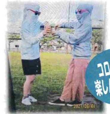
コロナ禍でも楽しんでます!

5月15日に地域で開催された「側溝清掃」に参加しました。重い鉄板を開けて、溝に溜まったヘドロは土嚢6袋になりました。