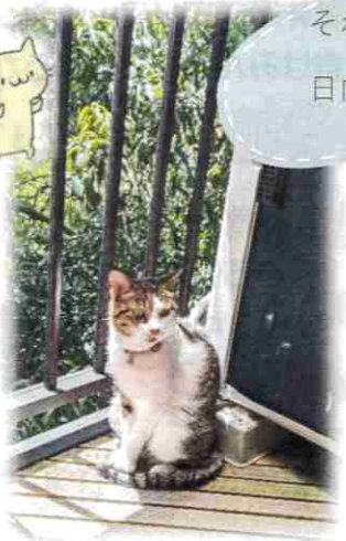
それぞれの日向ぼっこ

憩いの家に通ってくださっている皆さんにも、「コロナ対策、コロナ コロナ…」と、たいへん窮屈な思いをさせてしまっているのですが、職員の細かい指示にもしっかり耳を傾けて守ってくださっています。(ありがとうございます)