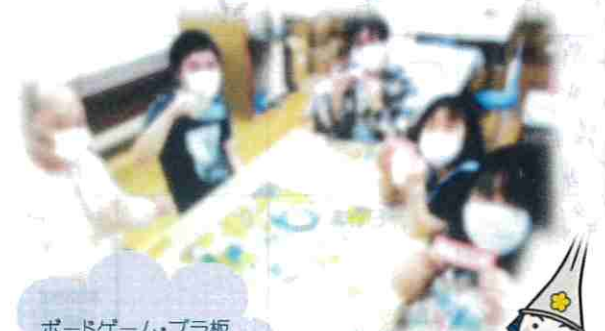
ボードゲーム・プラ板 どっちもやりたいな

5月1日(土)の昼食では皆さんでお祭り御膳とお楽しみタイムを開催しました。今までならこの日は高岡御車山祭りで、午後から盛大な7基の山車を見に出掛けていましたが、コロナウイルスの影響で昨年に続き